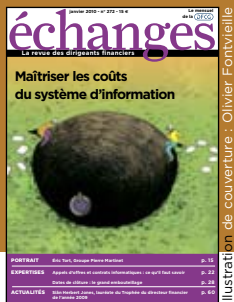
Illustration de couverture : Olivier Fontvieille

43 e année - Publication mensuelle Éditeur : Association nationale des directeurs financiers et de contrôle de gestion (DFCG), Association loi 1901 99, boulevard Haussmann, 75008 Paris (France). Tél. : 01 42 27 93 33 - Fax : 01 42 27 04 03 www.dfcg.com / www.revue-echanges.org